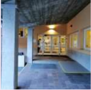
Ponte di Legno