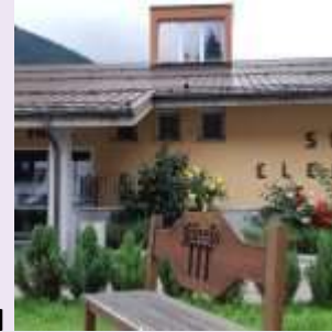
Ponte di Legno